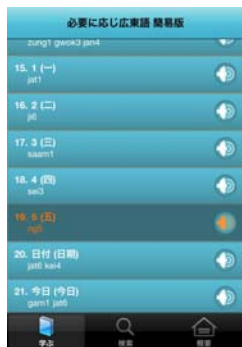
【図2】 必要に応じ広東語 数字も音声で聞ける。

広東語も聞いてみるとしよう。まず【図2】の[必要に応じ広東語 簡易版]である。これも必要な単語レベルと短いフレーズを広東語の音声とともに聞くことが可能である。もう一つのアプリは【図3】の[Lingopal Lite]である。このシリーズは中国語圏だけではなく、ヨーロッパ各国の言語など多くの言語がある。【図3】では“普通話”と広東語の対照になっているが、[設置]で対照する言語の切り替えが可能である。これも Lite 版でもそれなりのフレーズや表現の音声を聞くことができ、どれくらい違うのか、聞き比べることで、“普通話”の方言を知るきっかけにもなり、将来、上海語や広東語も学んでみたいと思うことがあるかもしれない。