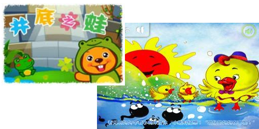
【図10】[夢絵本]シリーズ