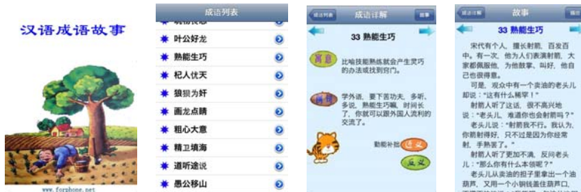
【図7】[Chinese Idioms] 成語をタップすると音声でできて、②をタップすると成語が持つ意味と例文がでてきて、[故事]をタップするとその物語がでてくる。

故事成語の文章は、中国語検定で言えば3級を取得した学習者または3級を目指す学習者にはちょうどよい文献である。成語とその成語ができる背景となる物語を覚えていれば、記憶もしやすいだろう。