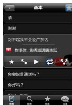
【図3】 Lingopal Lite