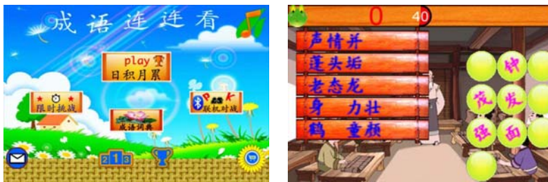
【図8】[成语连连看] 成語の穴埋めは意外に難しい。右は[限时挑战]の画面

故事成語の文章は、中国語検定で言えば3級を取得した学習者または3級を目指す学習者にはちょうどよい文献である。成語とその成語ができる背景となる物語を覚えていれば、記憶もしやすいだろう。